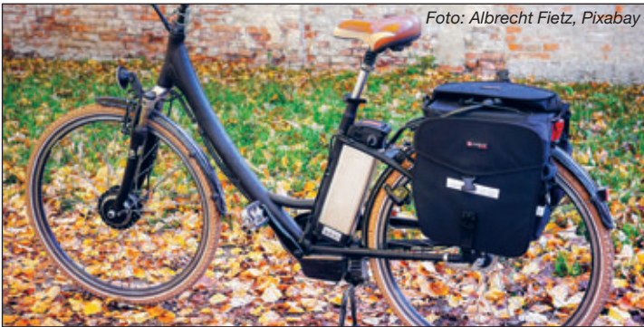
Text: Landkreis Zwickau, Amt für Abfallwirtschaft

www.landkreis-zwickau.de/annahmestellen veröffentlicht.