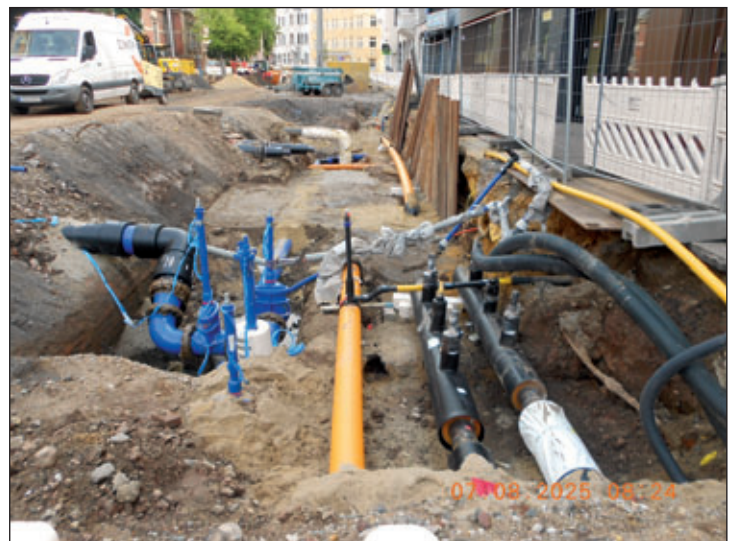
Rohrnetzerneuerung und Kanalnetzerneuerung in Zwickau, Bosestraße/Georgenplatz (geplante Fortsetzung aus dem Jahr 2025)

Presseinformation der Wasserwerke Zwickau GmbH vom 12.01.2026