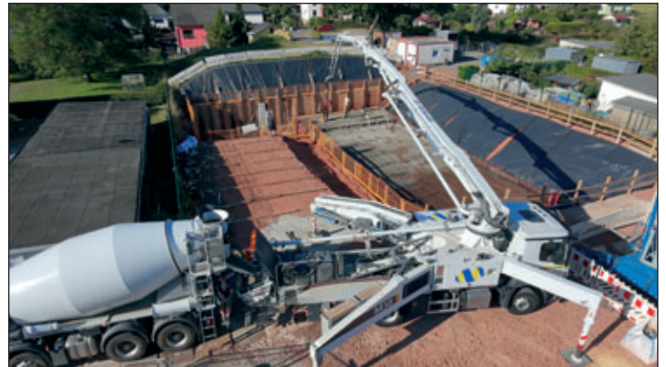
Ersatzneubau des Trinkwasserhochbehälters Crimmitschau West seit 2025.