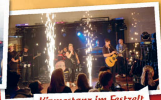
Kirmestanz im Festzelt