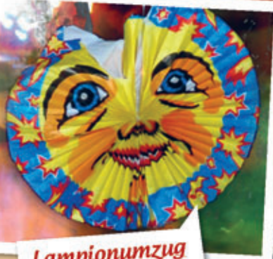
Lampionumzug ab Vogelsbrücke

großes Festzelt (beheizt) auf dem Mehrzweckplatz St. Micheln