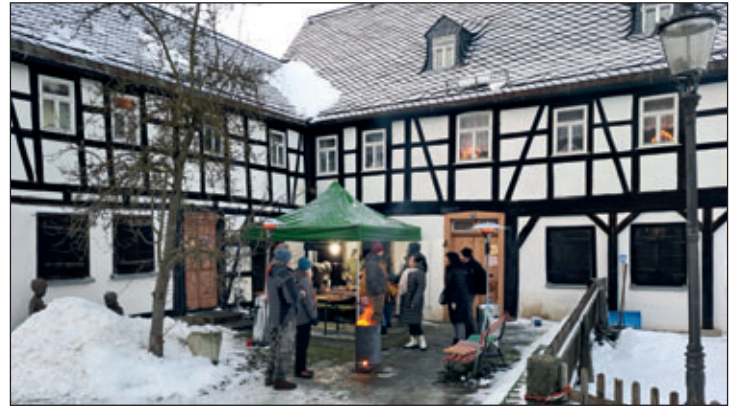
Der „beheizte“ Hofbereich

Abschließend können wir einschätzen, dass die Ausstellung ein voller Erfolg war, und sich alle Arbeit gelohnt hat. Auf diesem Weg möchte sich