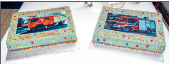
Zwei Geburtstagstorten, links das ausgemusterte LF16-TS, rechts das neue HLF20.