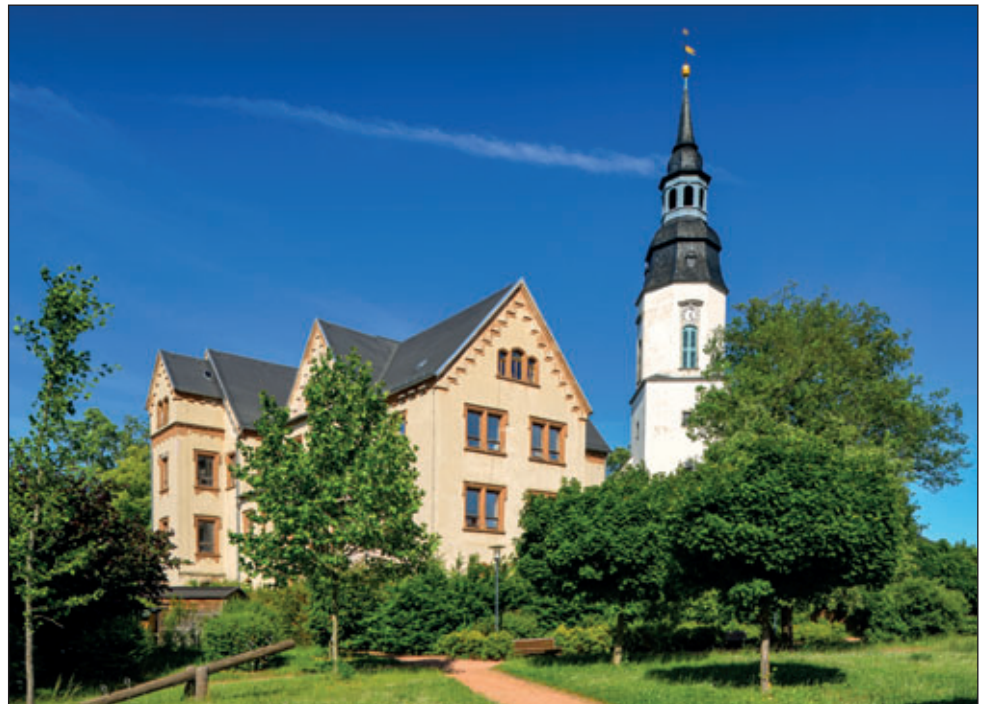
Kirche und Schloss 2017