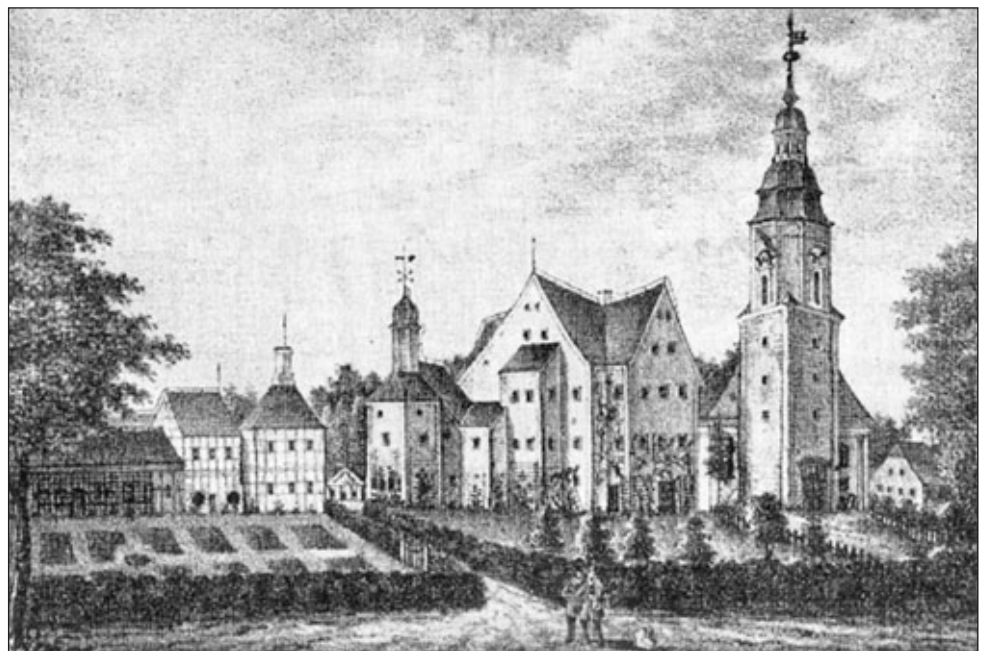
Kirche, Rittergut und Schloss nach 1731