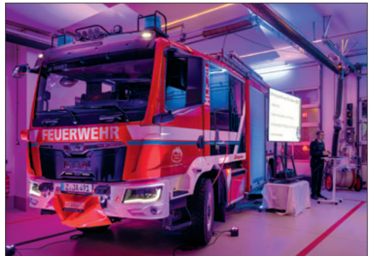
Das neue HLF20, welches bereits seit 30.10.2025 zu Einsätzen ausrückt.

Technik dieser Qualität hat natürlich ihren Preis. Insgesamt investierten wir 534.000 Euro in das neue Fahrzeug. Der Freistaat Sachsen hat die Anschaffung mit dem höchstmöglichen Förderbetrag von 194.000 Euro unterstützt, ausgezahlt über den Landkreis Zwickau. Die verbleibenden 340.000 Euro wurden aus dem Gemeindehaushalt finanziert. Sicherlich ein erheblicher Betrag, aber eine unverzichtbare Investition in den abwehrenden Brandschutz und die technische Hilfeleistung für unsere Gemeinde.